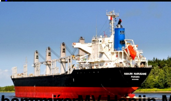
Global Maritime Trust (S) Pte Ltd 8 Eu Tang Sea Street #15-00 The Central Singapore 01818 Tel: (65) 67248628 Fax: (65) 67271000 Email: enquiry@gmt-trust.com

Le navire "HARIN MANGAME" a été charteré par Avra Shipping PTE LTD, battant pavillon