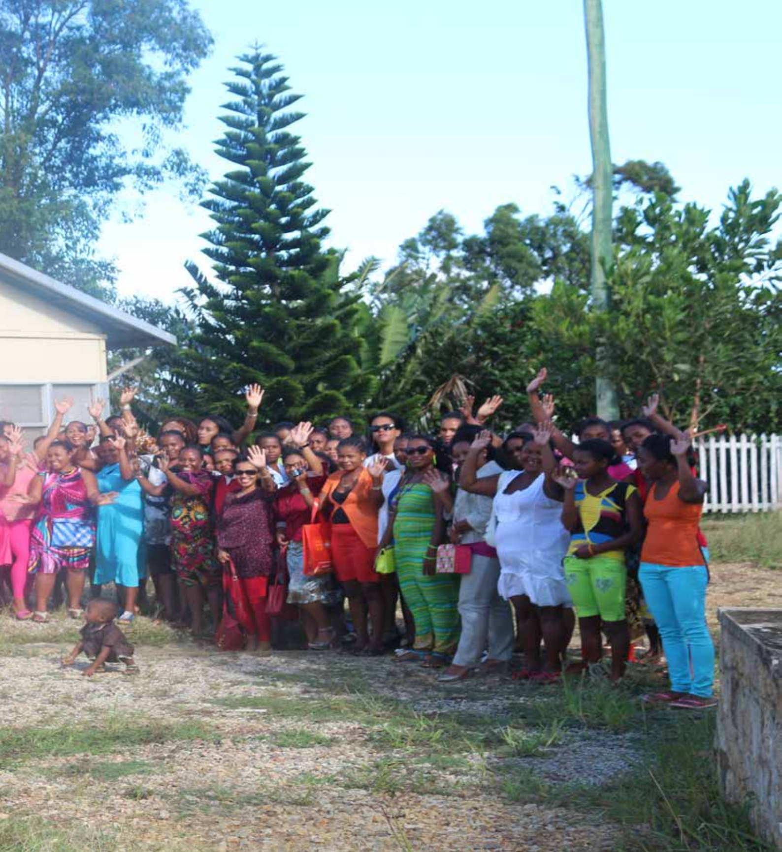
Les employés femmes et les femmes des employés ensemble pour marquer la Journée Mondiale de la Femme du 08 mars 2014