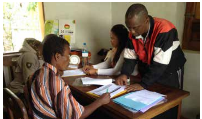
Signature d'un Protocole entre QMM et les associations en présence du Maire d'Ampasy Nahampoana et portant sur l'octroi d'un fonds de soutien en compensation des perturbations occasionnées par nos activités minières.

Les discussions et dialogues avec la direction de la sécurisation foncière au sein du Ministère d'Etat chargé des Projets Présidentiels, de l'Aménagement du Territoire et de l'Équipement, la région Anosy, les services techniques décentralisés, les représentants des occupants, la plateforme de la société civile œuvrant pour le foncier (SIF) et QMM ont porté sur les principes et les paramètres juridiques concernant les droits de propriété pour les occupants traditionnels en relation avec le régime foncier et les codes miniers. Des Fonds communautaires ont été également mis en place pour le rétablissement de la confiance.