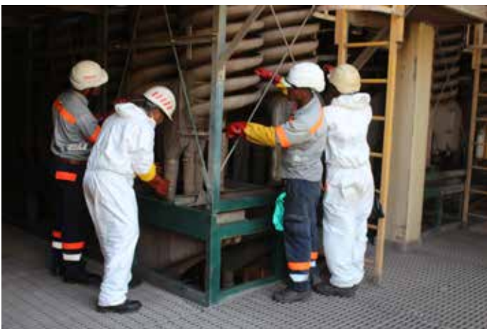
L'équipe de l'entreprise FAV GIE en train de nettoyer les spirales à l'usine