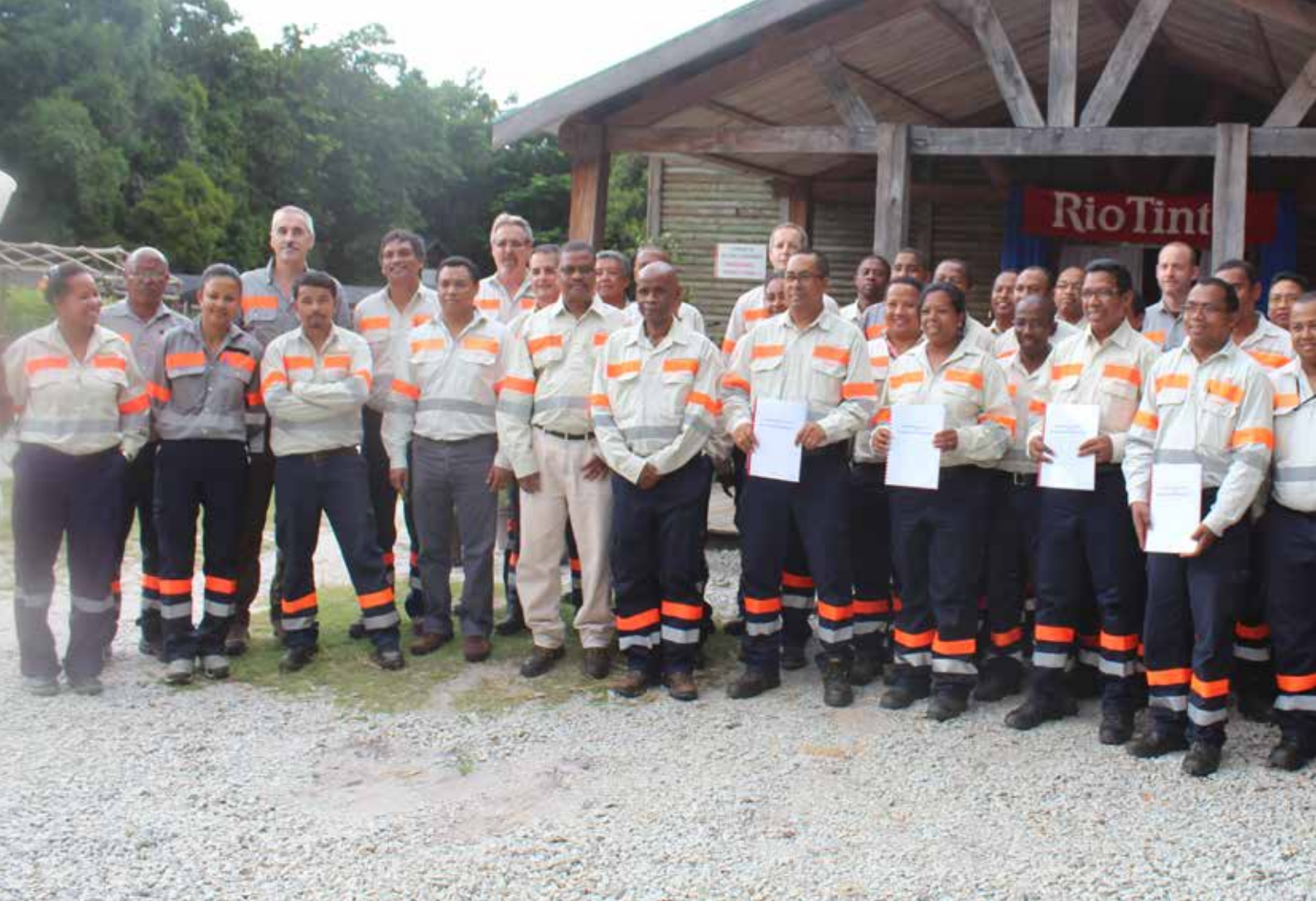
Les instances représentatives du personnel et les membres de la Direction lors de la signature de la Convention collective en décembre 2014