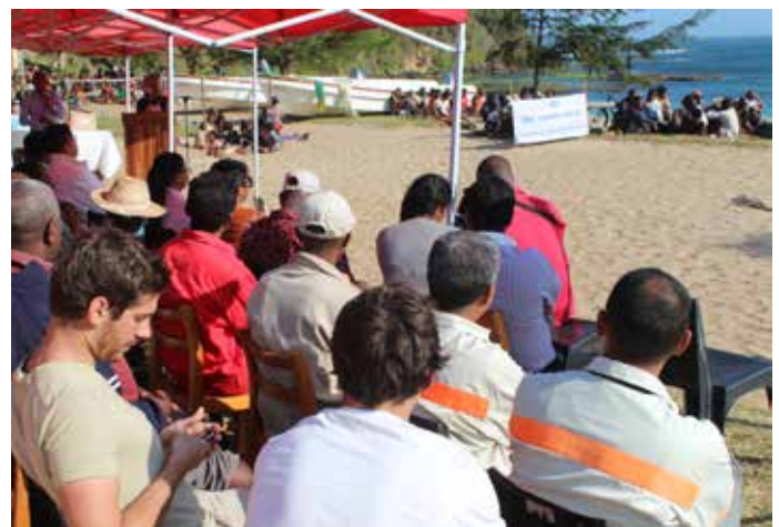
Cérémonie de remise de 02 bateaux de type XMC motorisés aux pêcheurs de Libanona destinés pour la pêche au large