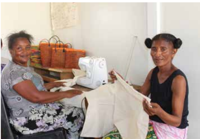
Membres de la coopérative LOVASOA MAHAVONJY, regroupant des femmes des communautés d'Ambinanibe, de Lohalovoka et d'Ilafitsinanana. Elles sont en train de confectionner des sacs pour des échantillons de sables minéralisés