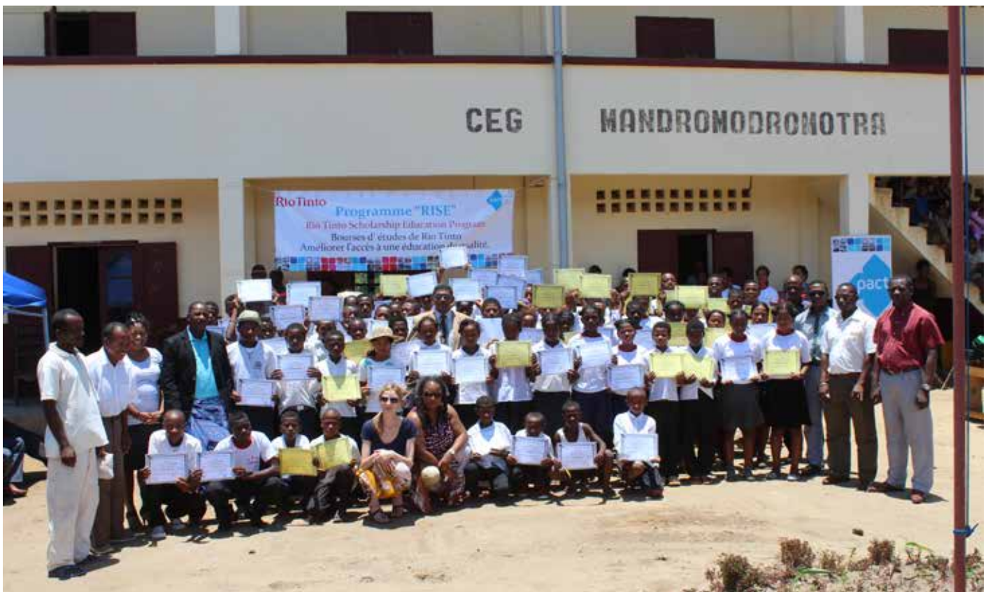
Cérémonie de remise de certificat pour les boursiers du Collège de Mandromondromotra