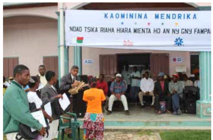
Remise de certificats aux agents communautaires dans le cadre du programme Kaominina Mendrika